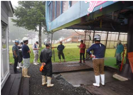
【7月予備原動エンジン講習】