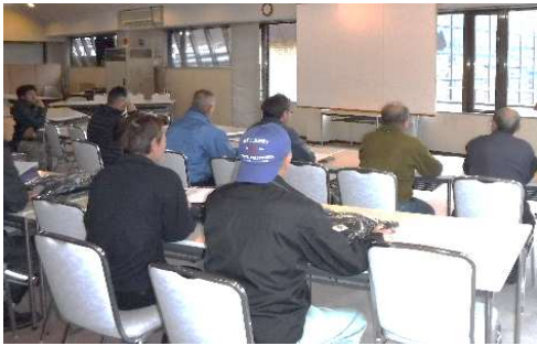
【12月冬季索道係員講習会】

令和4年7月14日 緊急時を想定した救助訓練・予備原動エンジン講習を実施しました。