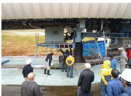
【12月予備原動機作動訓練】