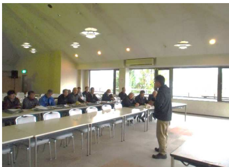
【12月冬季索道係員講習会】

令和1年9月2日 緊急時を想定した救助訓練・予備エンジン操作訓練を実施しました。