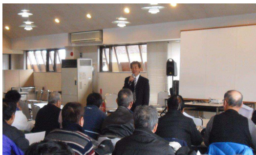
【12月冬季索道係員講習会】

平成28年8月8日 緊急時を想定した救助訓練・予備エンジン操作訓練を実施しました。