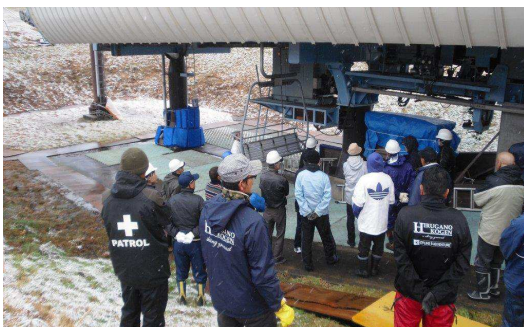
【12月予備原動機作動訓練】