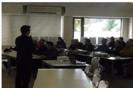
【12月冬季索道係員講習会】

平成27年7月18日 緊急時を想定した救助訓練・予備エンジン操作訓練を実施しました。