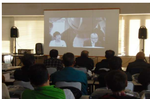
【12月救助訓練ビデオ鑑賞】