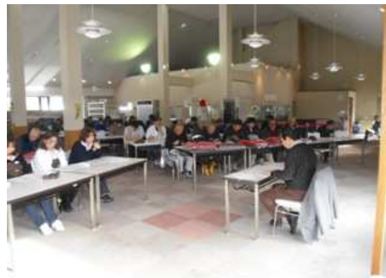
12月冬季索道係員講習会