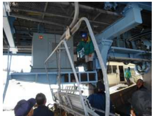
12月予備エンジン操作訓練