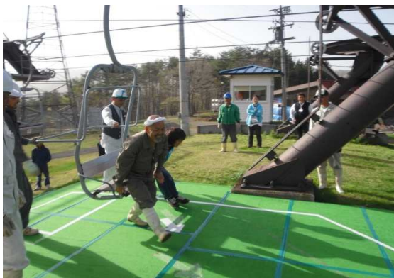
5月降り場での乗客への対応方法講習

平成23年12月15日 冬期シーズン索道スタッフ全員を対象とした索道研修会を実施いたしました。その他、各索道現場にて随時、安全に関する教育・運転取扱いに関する教育を行いました。