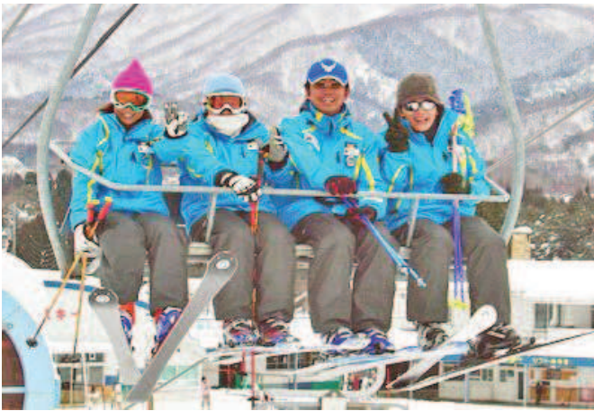
▲ウインターシーズン