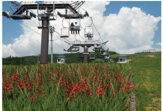
▲グリーンシーズン